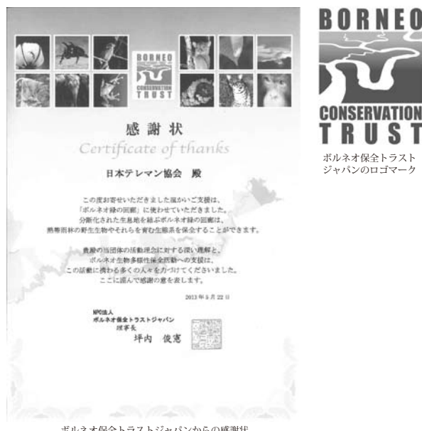
ボルネオ保全トラストジャパンからの感謝状

「緑の回廊」が実現すれば、動物たちの食糧や繁殖機会の確保につながり絶滅危機を回避することができるだけでなく、動物の生息域と農業用地の両立という「環境と産業の両立」が実現できると考えられています。